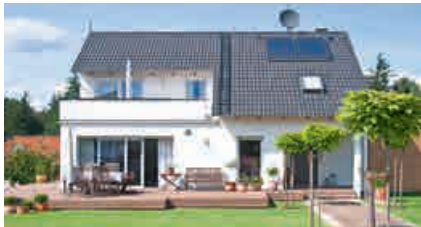
das Haus, -er